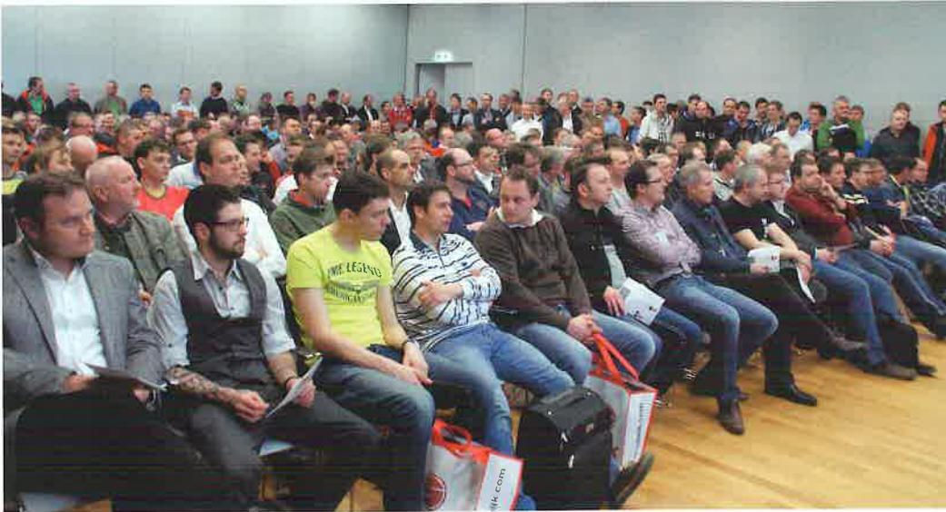
Über 500 Elektrotechniker und Planer kamen zur Präsentation von COMSCHÄCKE auf den Power-Days